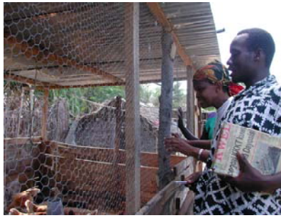
Esnati met een van de deelnemers.